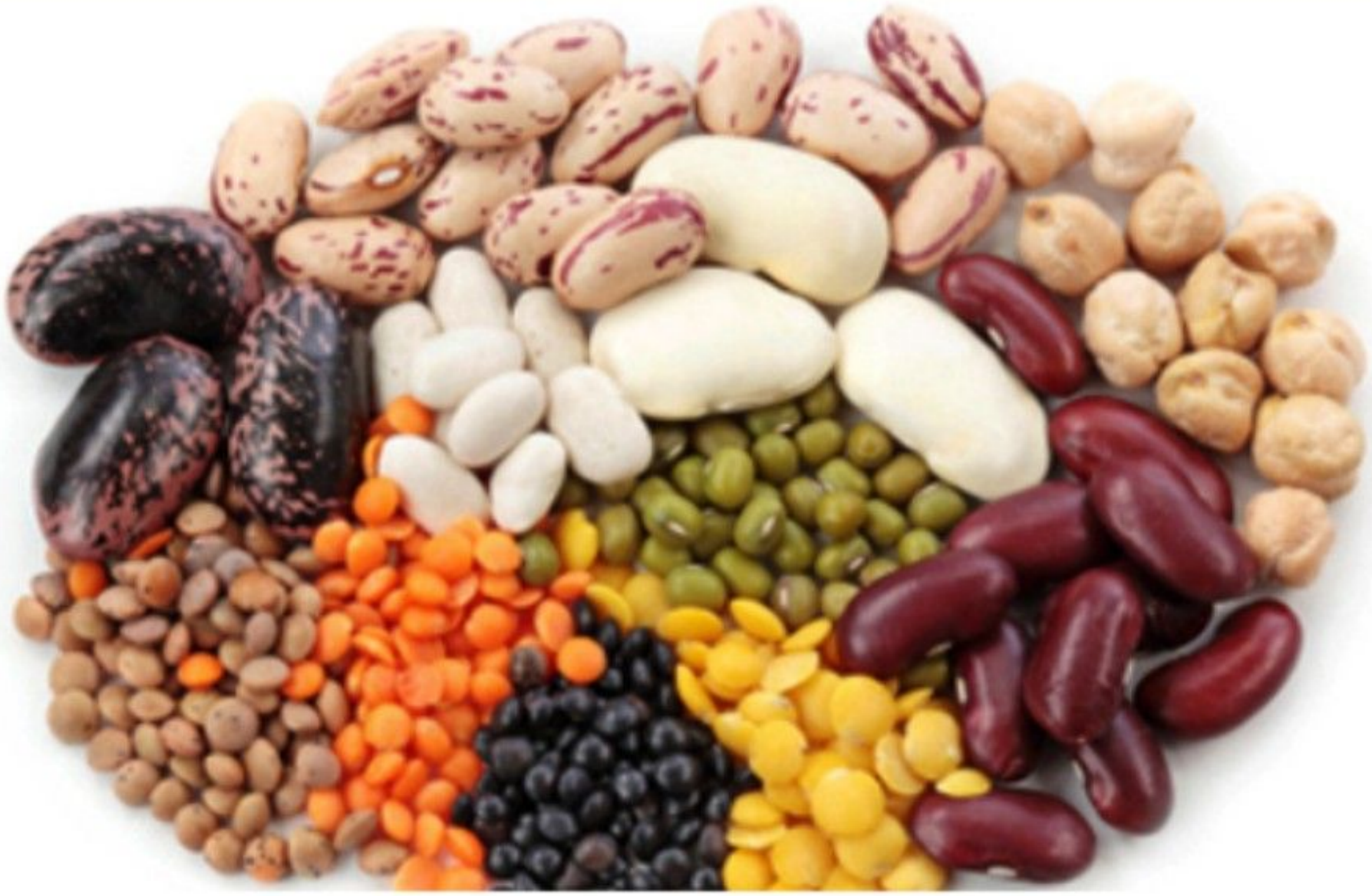
Govt approves export of all types of pulses

વર્ષ ૨૦૧૬-૧૭માં કઠોળનું ઉત્પાદન ખૂબ જ પ્રોત્સાહક છે અને તે અત્યાર સુધીમાં સૌથી વધુ છે. કઠોળની ૨૦ લાખ ટનની જાહેર ખરીદી આકર્ષક લઘુત્તમ ટેકાના ભાવે(એમએસપી) કરીને સરકારે ખેડૂતોને ટેકો આપ્યો છે. વર્ષ ૨૦૧૬-૧૭ દરમિયાન કઠોળનું રચાનિક ઉત્પાદન ૨૨.૯૫ મિલિયન ટન હતું. ચણા દાળ (ગ્રામ)નું ઉત્પાદન ૯.૩૩ મિલિયન ટન હતું, જે વર્ષ ૨૦૧૫-૧૬માં ૭.૦૬